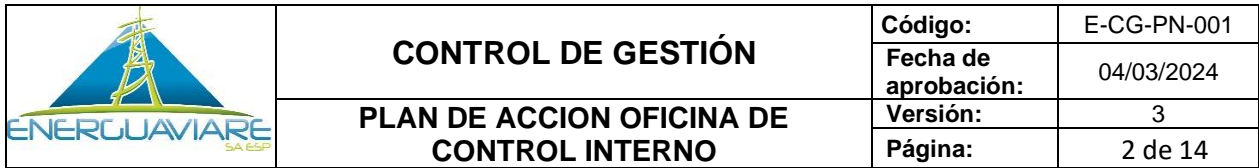
Tabla de contenido